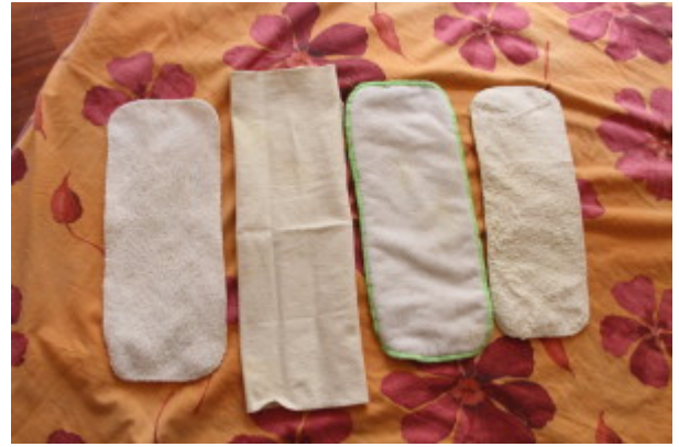
vari tipi di inserti (foto a sinistra) da inserire nella tasca del pocket (foto a destra)

La tipologia di chiusura dei pannolini e/o delle mutandine impermeabili è o con il velcro (più facile, più pratico, si adatta meglio alla taglia del bambino, ma si rovina più facilmente) o con i bottoncini (si adatta meno perfettamente alla taglia del bambino, però si rovina meno facilmente) oppure per i pannolini pieghevoli con la chiusura con Snappi o Nappy Nippa (vedi sopra).