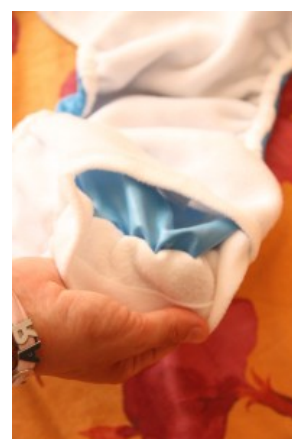
tasca del pannolino pocket