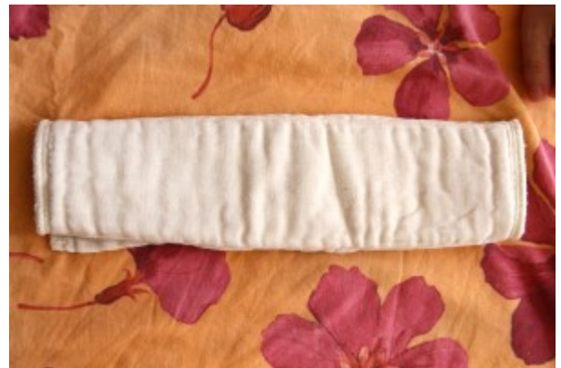
un altro esempio di piegatura di prefold (piegatura in tre parti)

Va indossata infine la mutandina impermeabile (vedi sotto).