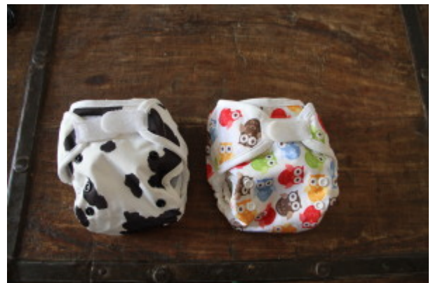
pannolini taglia neonato (2kg - 7kg)

Nei prossimi articoli spiegheremo con video dettagliati le varie sequenze di piegatura dei pannolini "a 2 pezzi".