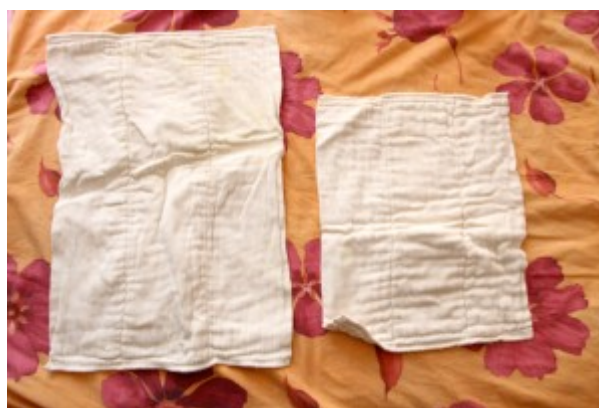
2 taglie diverse di prefolds aperti ( foto a sinistra) con dettaglio (foto a destra)