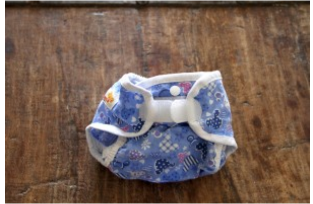
pannolino a taglia unica con bottoncini in sede frontale per riduzione della taglia