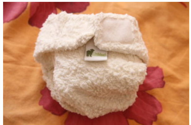
fitted + mutandina impermeabile (vedi sotto)