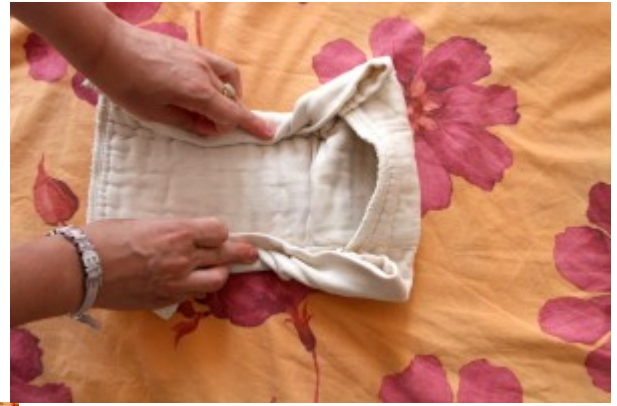
un esempio di piegatura (piega cattura-pupù per neonato) di prefolds con chiusura finale con Snappi